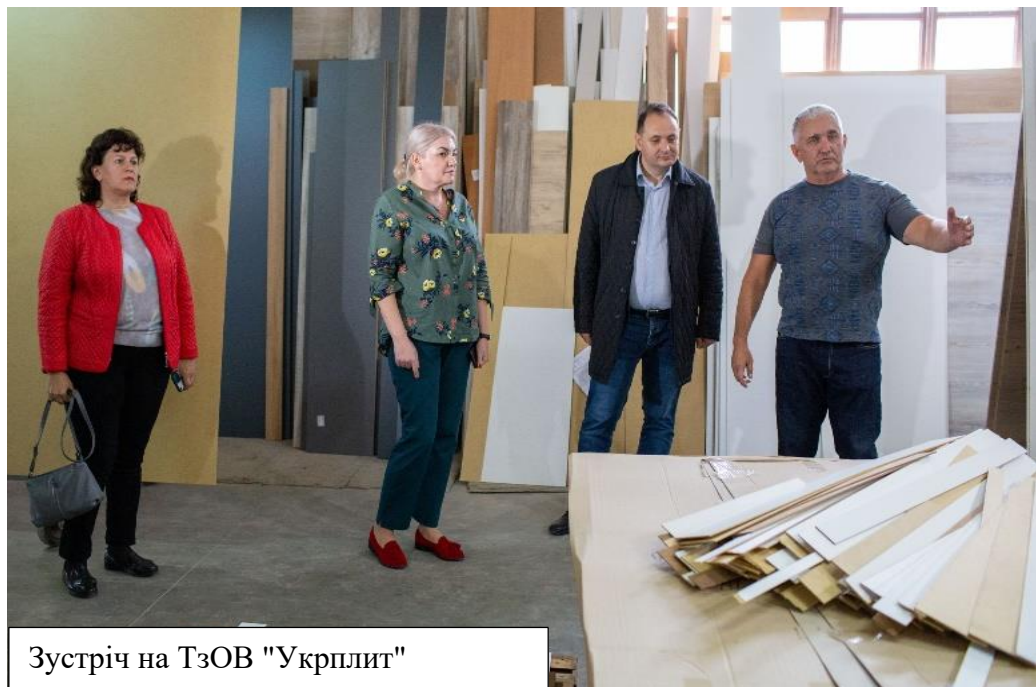
Зустріч на ТзОВ "Укрплит"

Організовано бізнес-п'ятницю, в рамках яких відбулися відвідини міського голови Р.Марцінківих місцевих та релокованих підприємств малого і середнього бізнесу з метою ознайомлення з їх діяльністю, існуючими проблемами та подальшими перспективами розвитку. Зокрема, відвідали релоковане з м.Миколаєва підприємство ТМ "Лакомка" – сімейний бізнес з виробництва зефіру, франківське меблеве виробництво "Укрплит", місцеве ПП "Інструмент", яке виробляє пластмасові крісла-розкладачки, здійснює високотехнологічний ремонт складних деталей та виготовлення прес-форм.