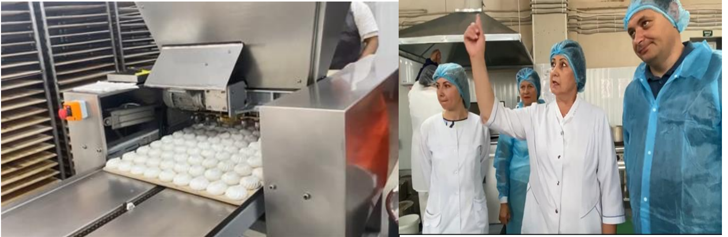
Зустріч на ТМ "Лакомка"

Завітали також на фермерське господарство "Узин" з вирощування бройлерів в с.Узин.