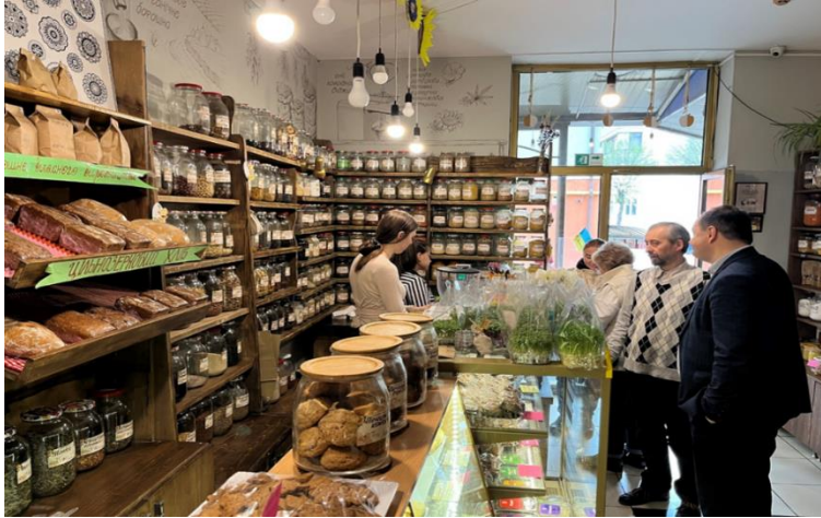
- магазин корисних продуктів "Кошик здоров'я"

А також незвичайний бізнесовий об'єкт - особливе підприємство УТОС, навчально-виробниче підприємство незрячих. Йдеться не про гроші чи успішні проєкти, а соціальне підприємництво, яке в Івано-Франківську необхідно розвивати. Наразі тут виготовляють та реалізують картонну продукцію, зокрема папки та швидкозшивачі.